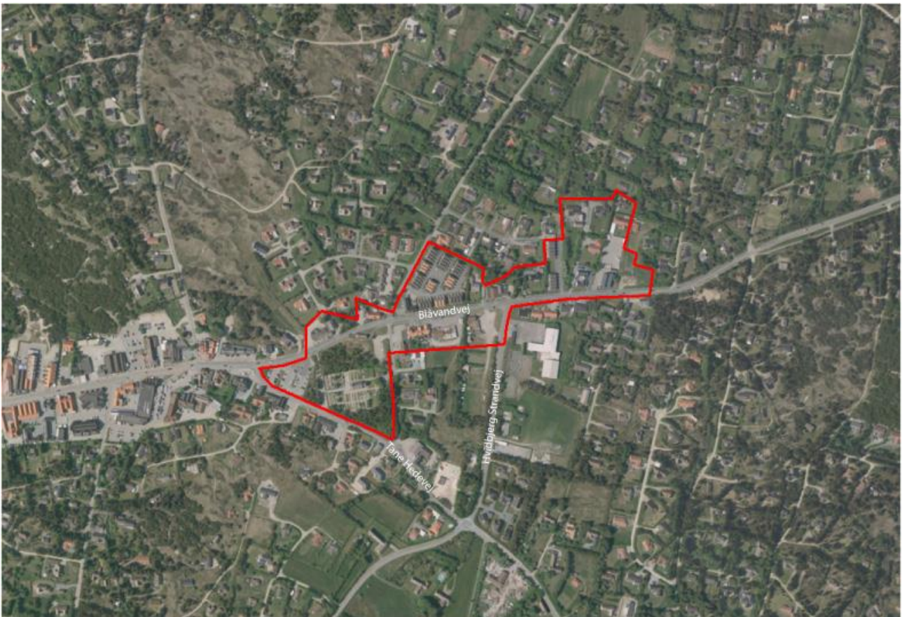
Enkeltområde 05.01.C04 og 05.01.001 afgrænsning er vist med den røde linje

Det udpegede område, der ligger mellem Tane Hedevej, Hvidbjerg Strandvej og Vandflodvej i Blåvand, udgør et areal på ca. 7 ha og er omfattet matrikel nr. 34a, 34aa,34b, 34e, 34i, 34n, 37ø, 38aa, 38ab, 38g, 39k, 40g, 41ad, 41ap, 41cq, 42k, 51b, 51c, 51h, 53ab, 53i, 53m, 96, 102 og 7000u Vandflod By, Oksby, samt en del af matrikel nr. 37n, 51l og 51p, Vandflod By Oksby.